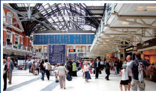
大型公共建筑 LARGE-SCALE PUBLIC PLACES